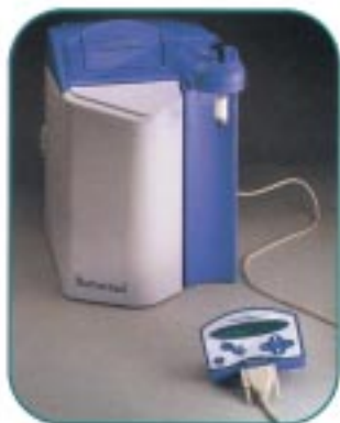
面板 10 呎遙控